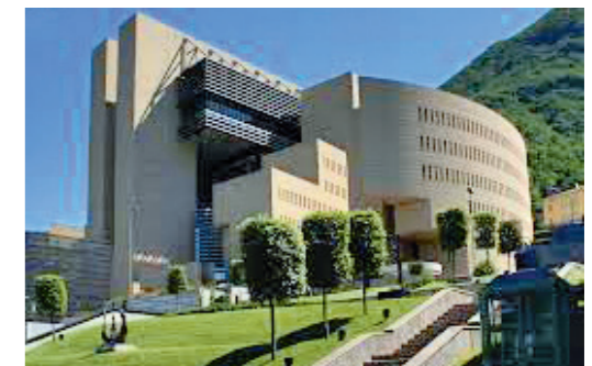
Casino di Campione d'Italia