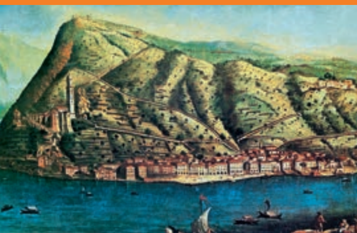
Veduta di Morcote e della Chiesa di Santa Maria del Sasso dalla riva opposta del lago di Lugano. Olio su tela, Giorgio Domenico Fossati, 1758 ca. (Collezione Repubblica e Cantone Ticino, Bellinzona)

23-24 marzo 2024 IN OCCASIONE DELLE GIORNATE FAI DI PRIMAVERA