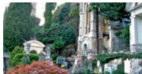
Viale d'ingresso del Cimitero

C ompreso nel Complesso monumentale di Morcote, è stato realizzato dopo il 1750 e via via ampliato: comprende tombe e cappelle di illustri personaggi della regione e notevoli opere artistiche dal XVIII al XX secolo.