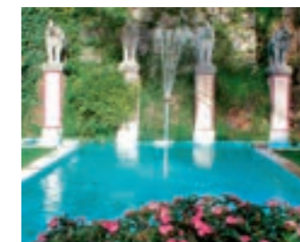
Palazzina indiana (esterno)

• VISITA INEDITA del cortile e degli interni di Casa Scherrer: ore 14:00-17:00 per gruppi di 12 persone senza prenotazione. Ingresso di fronte all'entrata del Parco.