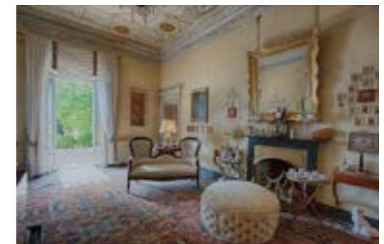
Orta, Villa Fogazzaro Roi. Bene FAI