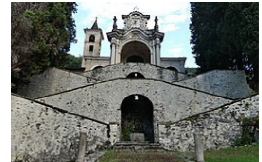
Campione d'Italia, Santa Maria dei Ghirli